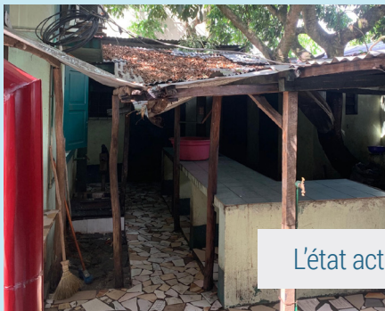
L'état actuel de la cuisine

Donc l'objectif est de réaliser pour l'essen-